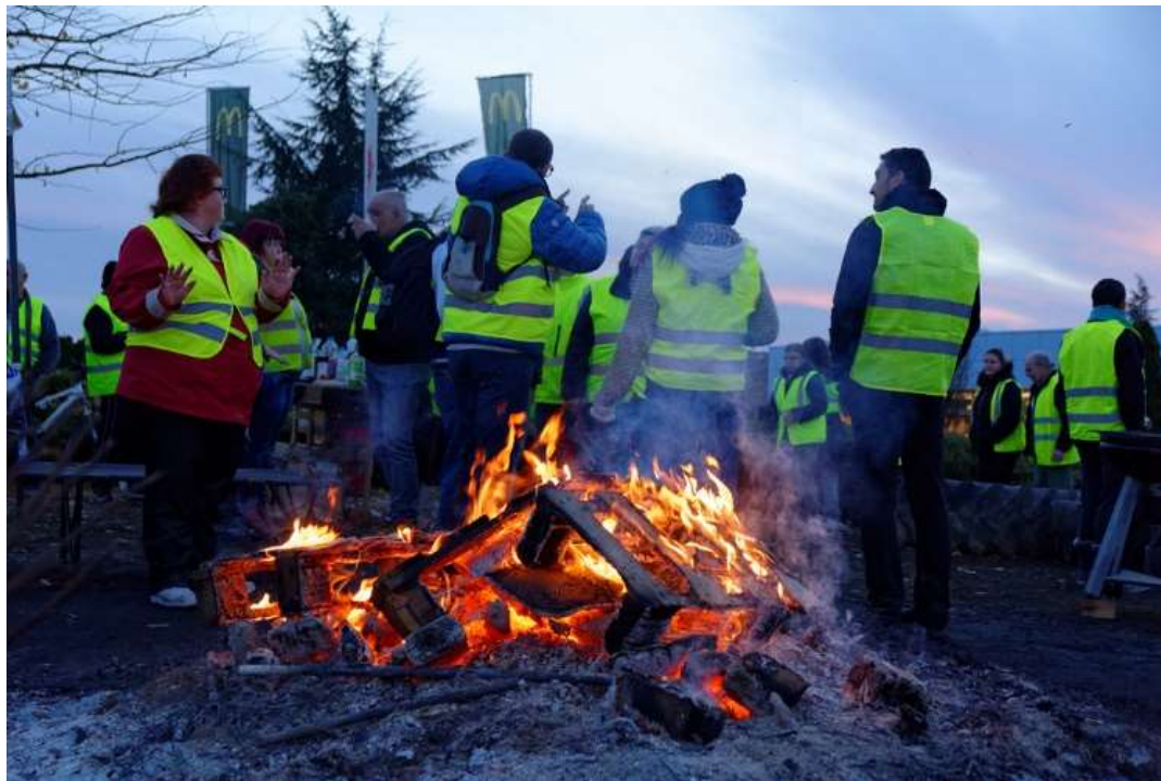
Manifestation du mouvement des gilets jaunes, à Andelnans, le 24 novembre 2018