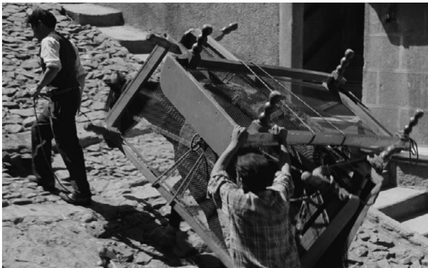
A Valparaíso

Jusqu'au 18 décembre • Entrée payante Centre Pompidou • Cinémas 1 et 2 • Niveau 1 et -1 • Entrée Centre Pompidou