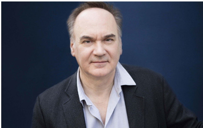
Hervé Le Tellier © AVT

Cartographie de l'humour en littérature par Hervé le Tellier