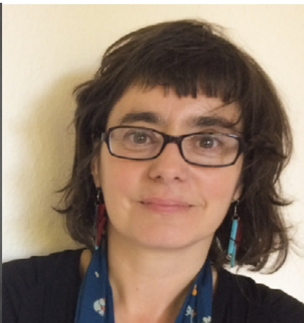
Artmut Rosa / Edwige Chirouter

Vendredi 20 novembre • 19h • Entrée libre Centre Pompidou • Cinéma 1 • Niveau 1 • Entrée Centre Pompidou