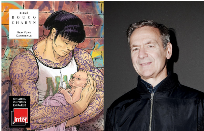
© Fried Kthm - François Boucq / Le Lombard

Jeudi 12 novembre • 18h30-19h30 • Entrée libre pour la rencontre • Atelier sur inscription Bpi • Salon graphique • Niveau 1 • Entrée rue Beaubourg