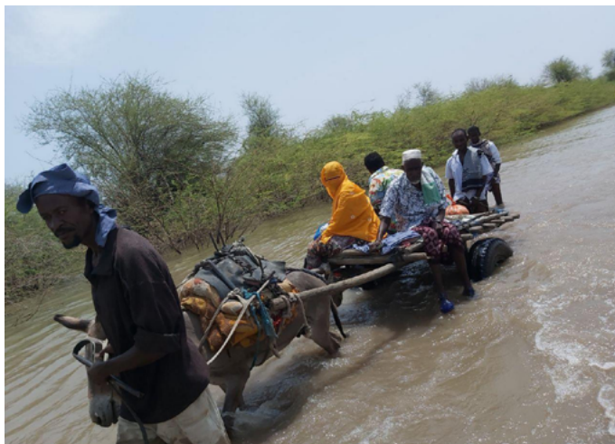
Des inondations submergent certaines parties du camp de réfugiés d'Aysaita en Éthiopie