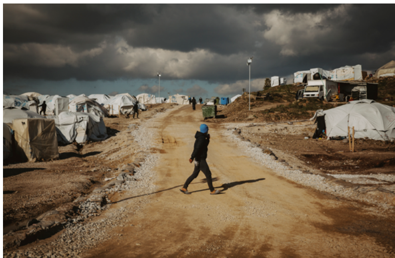
Centre d'accueil et d'identification de Mavrouni (Grèce)

Statuts des migrants, politiques migratoires, grands flux de populations, réalités et violences des parcours d'exil : ces sujets seront au cœur du cycle de rencontres destiné à présenter un tableau complet et nuancé des migrations humaines de nos jours.