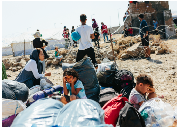
Une demandeuse d'asile afghane et ses enfants sur le site d'urgence Kara Tepe sur l'île grecque de Lesbos