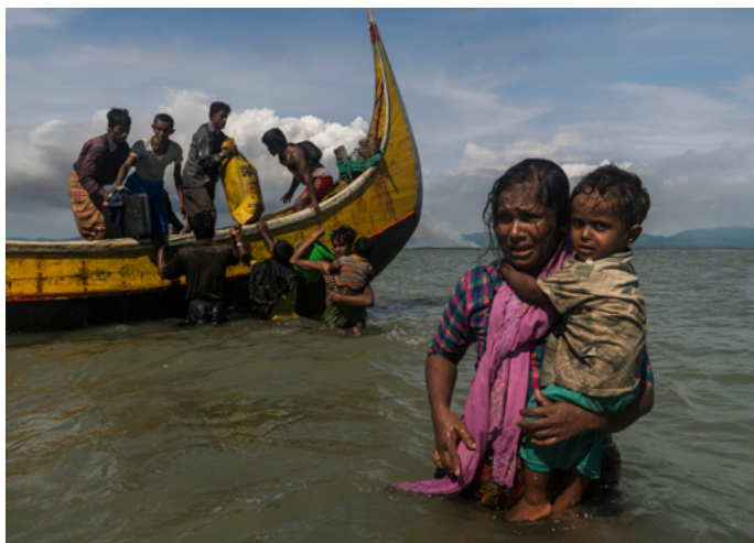
Des Rohingyas fuyant le Myanmar en bateau

Lundi 21 février • 19h • Cinéma 2 • Centre Pompidou