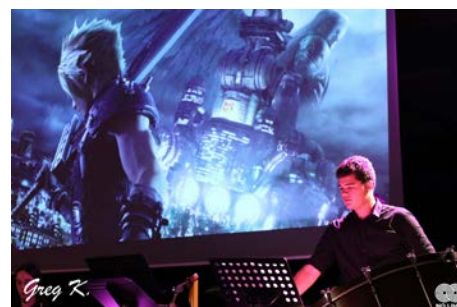
No Limit Orchestra

Fondé à Strasbourg début 2018 par le musicien et chef d'orchestre Frédéric Durmann, le No Limit Orchestra est spécialisé dans l'interprétation de musiques de jeux vidéo, de films et de films d'animation. Constitué de plus de cent musiciens professionnels et amateurs, l'orchestre constitue un objet artistique original, à la croisée des chemins entre les univers « geek », le numérique et la musique orchestrale. Il figure parmi les pionniers en France dans ce concept novateur. Depuis sa création, le No Limit Orchestra a donné plus de 50 concerts, dont 4 en autoproduction, et a joué devant plus de 15 000 spectateurs. La formation de base est celle d'un grand orchestre pouvant aller jusqu'à cent musiciennes et musiciens, parfois également complété d'un chœur. À côté de ce grand format emblématique, le No Limit Orchestra a également développé des ensembles de trois à quinze interprètes : trio piano-violon-harpe, quatuor de percussions et voix, quintette de cuivres, etc. Humoristiquement surnommés les « Nano Limit Orchestras », ces petites formations permettent au No Limit Orchestra d'intégrer des réseaux de diffusion associatifs ou socioculturels, et de se produire dans des formules type « concerts de rue », fêtes de quartier, animations, etc. Pour Press Start 2022, c'est le talentueux quatuor de saxophones qui vous fera voyager dans les partitions vidéoludiques !