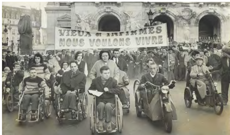
Manifestation de personnes handicapées et de vieillards en 1963 à Paris, pour défendre la hausse des allocations