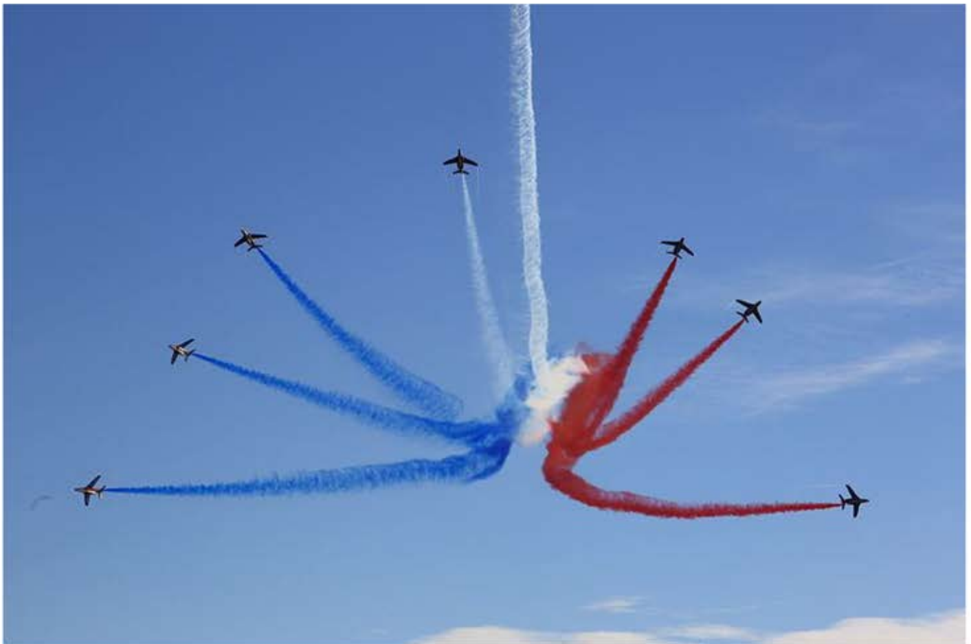
Hans A. Rosbach (Wikimedia Commons)

Du 6 septembre au 6 novembre 2023, la Bibliothèque publique d'information vous propose une sélection de ressources sur la place de la souveraineté dans l'économie internationale.