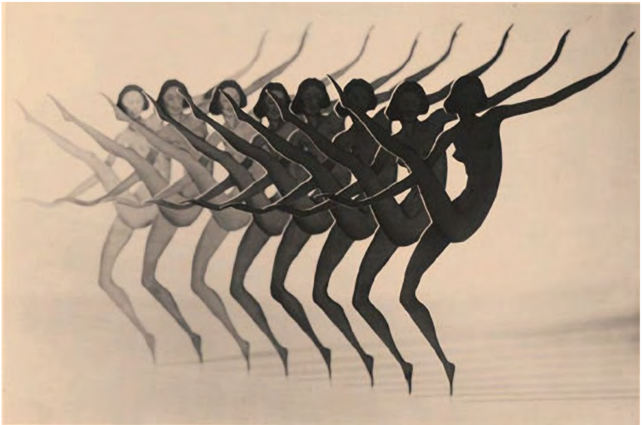
Dancers , photo de František Drtikol (1930) - Courtesy of the Museum of decorative arts in Prague

Pour accompagner la rencontre Fictions-Science du 6 juin conçue par la Bpi, La Parole-Centre Pompidou et l'Ircam à l'occasion du festival Manifeste, la Bpi présente une sélection de ressources consacrée à l'apport du numérique dans la création chorégraphique contemporaine.